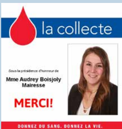
Collecte de sang

Une première année complétée pour le jardin collectif pédagogique de l'école des Moulins et du camp de jour. En tout, ce projet a permis la réalisation de 62 heures d'animation allant de l'atelier de recettes et de dégustation de salade à la création de plates-bandes gustatives en passant par les tâches d'entretien général d'un jardin. Environ 30 kg de légumes ont été récoltés et mangés! Le projet a récolté le prix Coup de cœur lors du congrès annuel du loisir municipal. Un grand merci à tous les participants, mais également à nos précieux partenaires la Caisse Desjardins de Joliette et du Centre de Lanaudière, Cent degrés, le Fonds de protection de l'environnement matawinien (FPEM), ainsi que Bois Desroches, fournisseur de bois officiel.