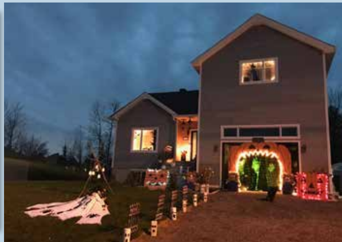
Halloween, prix du public